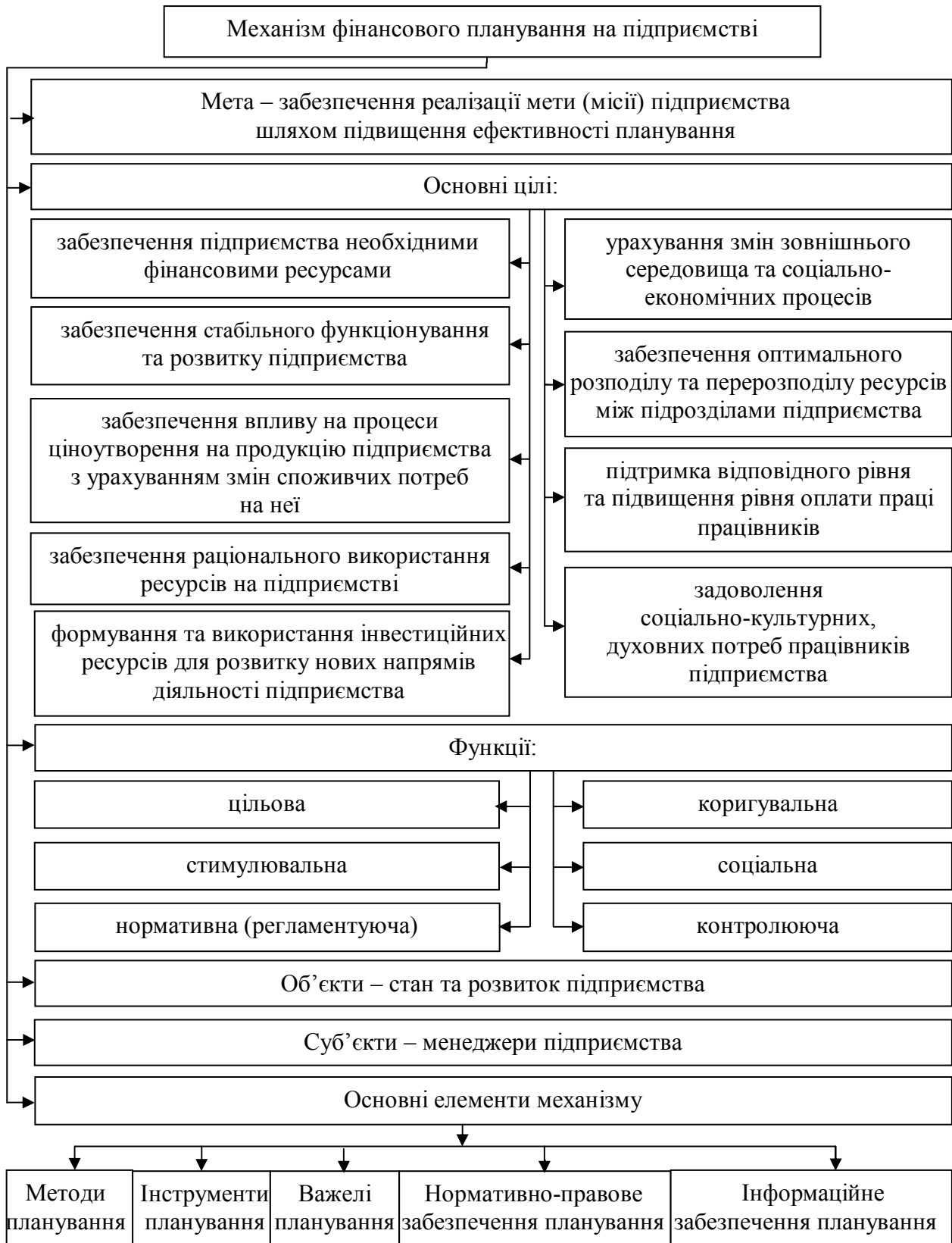
Рис. 1. Механізм фінансового планування на підприємстві

Концептуальною умовою здійснення фінансового планування на підприємстві, його організації та безпосереднього механізму планування було визначено дотримання принципів планування.