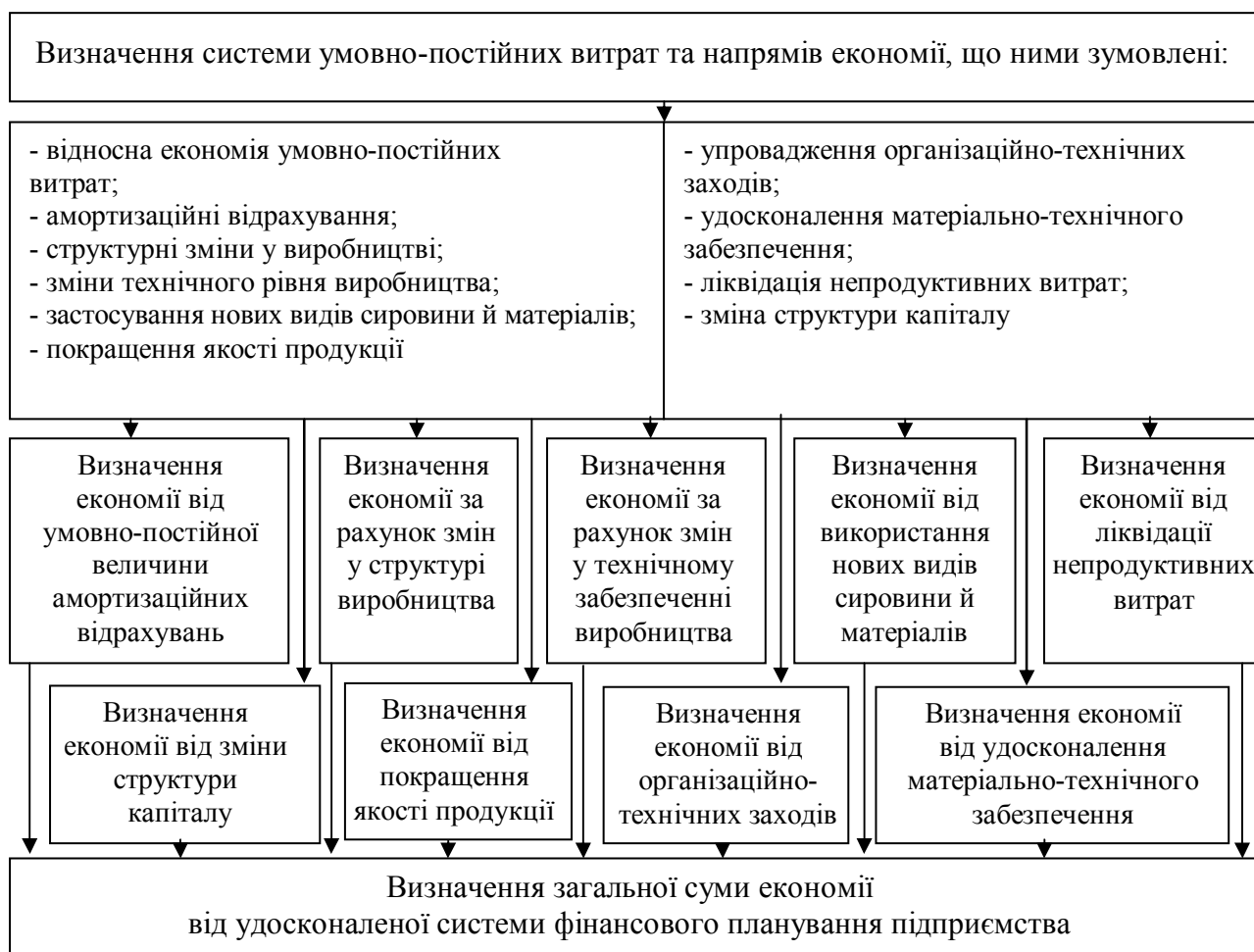
Рис. 2. Методичний підхід до визначення відносної економії умовно-постійних витрат підприємства

З метою фінансового стимулювання збільшення обсягу економічного ефекту запропоновано шкалу зміни базового рівня премії працівникам структурних підрозділів залежно від коефіцієнта напруженості.